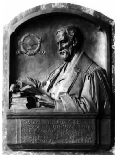
图5 吉布斯青铜纪念像（耶鲁大学吉布斯实验室入口处）

在学生们的怀念和回忆中，他们特别喜欢导师经常课余带他们去爬山。吉布斯认为登山者与物理学家有许多很相似的特质：他们都耐得住孤单的旅程，总是向最高峰挑战，仔细地规划行进路径，并在艰难的攀登中自得其乐。