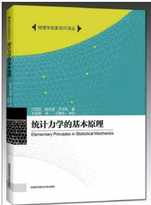
图3 《统计力学的基本原理》中文版，中国科学技术大学出版社，2016年

量分析要素》起初并没有公开发行，仅在1881年和1884年授课时为学生作了少量的印刷。但这份讲义被后人认为是现代向量分析的开端。此外，在数学领域，他还发现了一个今天广为人知的傅立叶级数的“吉布斯现象”。