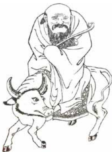
图 1 老子

山野蛮人在他最近所谓的游记“阿拉斯加” [2] 之结尾中写到：“大至天地万物，细如芸芸众生，究其宗者，在圣人老聃看来本质上也不过是一条短短的四阶积分链：“人法地，地法天，天法道”，始于道、终于人。而主宰这条积分链的控制系统也颇为简单，即老子所说的“道法自然”，一个全信息反馈的控制器。所谓的“大道至简”！”本文尝试揭示老子这宇宙定律与全状态反馈控制系统的关系。